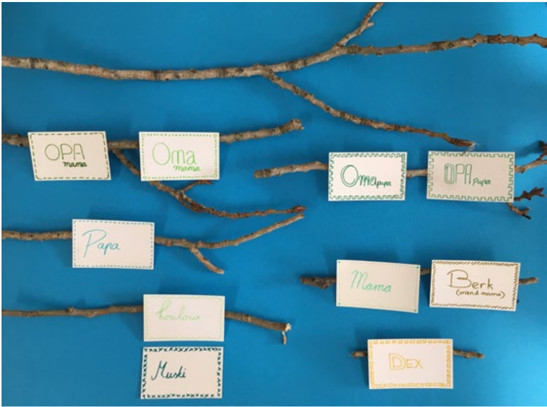
BIJLAGE 6: voorbeelden van stamboommobiles