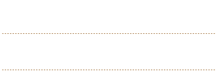
Schetsontwerp beeldverhaal RijnGouwewijn, Nic Hess | Kunstgebouw en SKOR, 2011