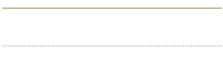
Schetsontwerp beeldverhaal RijnGouwewijn, Nic Hess | Kunstgebouw en SKOR, 2011