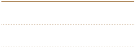
Schetsontwerp beeldverhaal RijnGouwewijn, Nic Hess | Kunstgebouw en SKOR, 2011